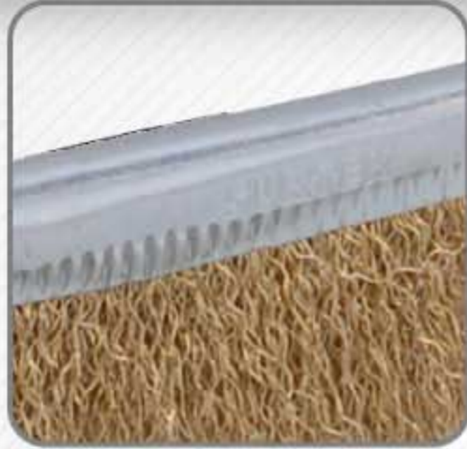
Fuerte amarre que evita el desprendimiento de alambre.