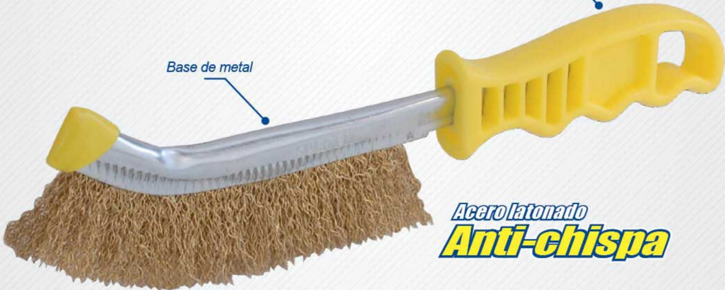
Base de metal