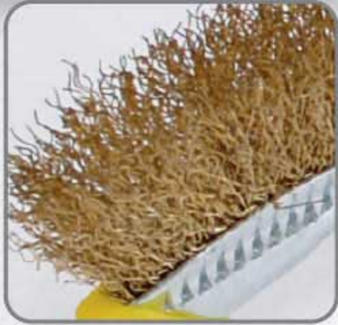
Alambre de acero latonado (anti-chispa) calibre 0.32mm.